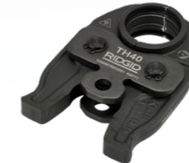
TH - U - G - RF 12 - 40 mm