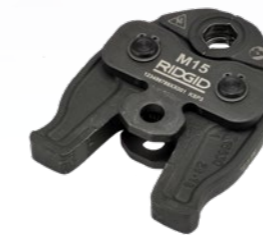
M - V 12 - 35 mm

Zaciskarka RP 219 jest kompatybilna ze wszystkimi szczękami 19 kN o każdym profilu, począwszy od profili M i V dla średnic do 35 mm dla połączeń metalowych, aż do TH, U, G i RF dla średnic do 40 mm dla systemów PEX i wielowarstwowych.