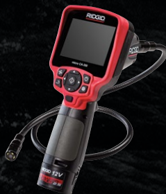
63888 CA-350X KAMERA RĘCZNA