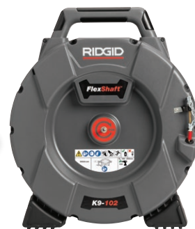
64268 FLEXSHAFT, K9-102 GLOBAL