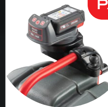
68568 ADAPTER UCHWYTU CSX VIA DO BĘBNA STANDARD / MINI