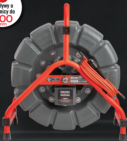
63628 SEESNAKE® MINI Z TRUSENSE™