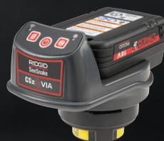
71313 ZESTAW CSX VIA + BATERIA