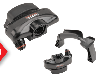
67808 ZESTAW ADAPTER CA-350 Z UCHWYTEM DOKUJĄCYM