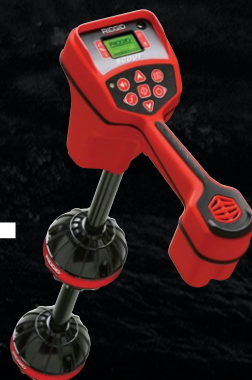
19243 LOKALIZATOR NAVITRACK SCOUT