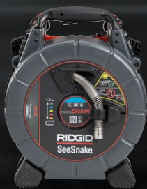
70023 SEESNAKE® MICRODRAIN APX™