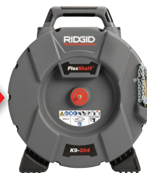
64278 FLEXSHAFT, K9-204