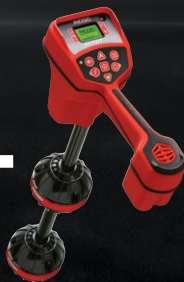
19243 LOKALIZATOR NAVITRACK SCOUT