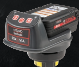
71313 ZESTAW CSX VIA + BATERIA