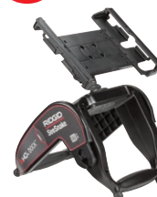
67363 STATYW Z UCHWYTEM DOKUJĄCYM HQX®