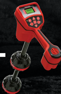
19243 LOKALIZATOR NAVITRACK SCOUT