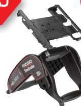
67363 STATYW Z UCHWYTEM DOKUJĄCYM HQx®