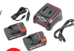
61743 ZESTAW 2 BATERIE / 1 ŁADOWARKA EU 2.5 AH