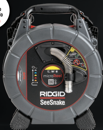
75853 SEESNAKE® MICROREEL™ APX™ + VIA™