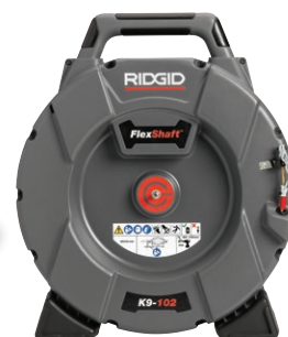
64268 FLEXSHAFT, K9-102 GLOBAL