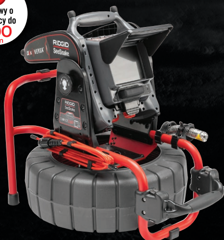
64208 SEESNAKE® COMPACT C40 Z TRUSENSE™