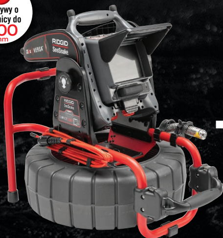
64213 SEESNAKE® COMPACT M40 Z TRUSENSE™