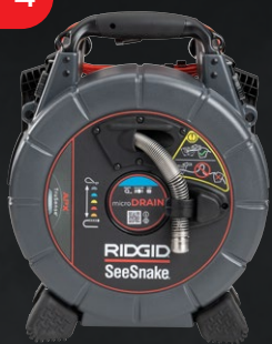
70023 SEESNAKE® MICRODRAIN APX™