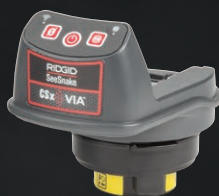
66523 URZĄDZENIE CSX VIA Z WIFI