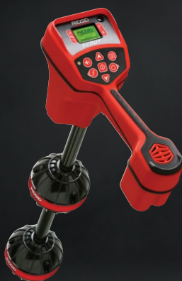
19243 LOKALIZATOR NAVITRACK SCOUT