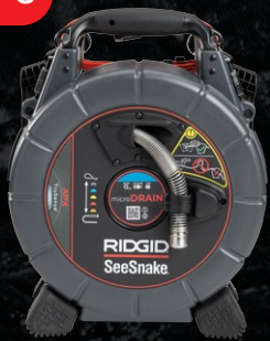
70023 SEESNAKE® MICRODRAIN APX™